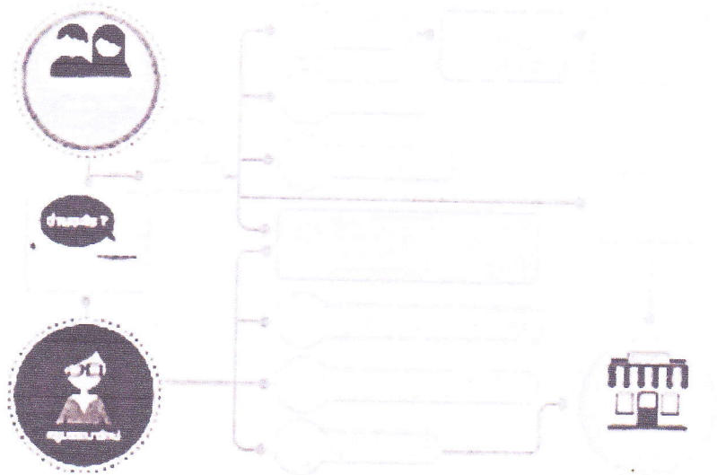
โครงการส่งเสริมการอ่านโรงเรียนต้นแบบ น่านมีบุ๊คส์รีดตั้งคลับ

ขอเชิญชวนโรงเรียนทุกสังกัดที่ส่งเสริมเรื่องการอ่าน สมัครเข้าร่วมโครงการ ฟรี (ไม่มีค่าใช้จ่าย)