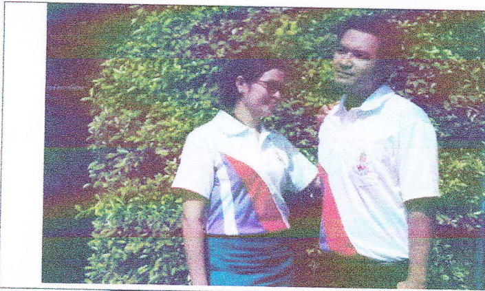
แบบที่ 1 ขาว-คาดสีม่วง