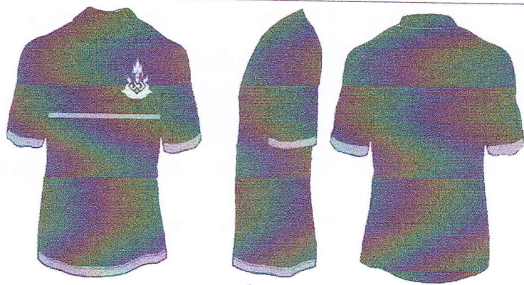
แบบที่ 3 ดำ