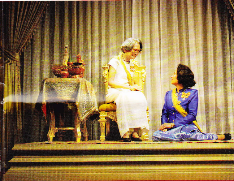
พระบรมรูปสมเด็จพระศรีนครินทราบรมราชชนนี และพระบรมรูปสมเด็จพระเจ้าพี่นาง เจ้าฟ้ากัลยาณิวัฒนา กรมหลวงนราธิวาสราชนครินทร์ Her Royal Highness Princess Srinagarindra the Princess Mother and Her Royal Highness Princess Galyani Vadhana Krom Luang Naradhiwas Rajanagarindra