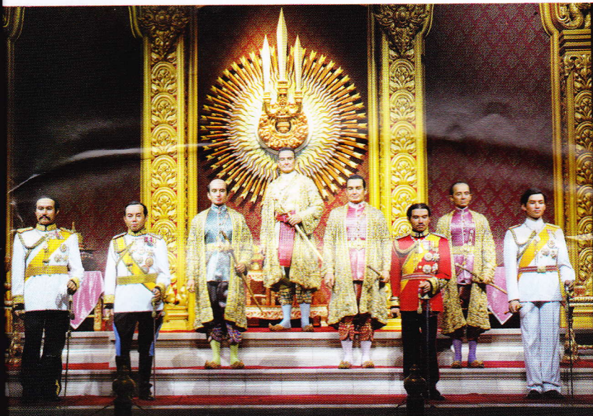
พระบรมรูปอดีตพระมหากษัตริย์ราชวงศ์จักรี รัชกาลที่ ๑ - รัชกาลที่ ๘ FORMER MONARCHS OF THE CHAKRI DYNASTY (RAMA I - VIII)

AMAZING WORLD OF REFLECTIVE KNOWLEDGE : EXCITING WITH REALISTIC ATMOSPHERE