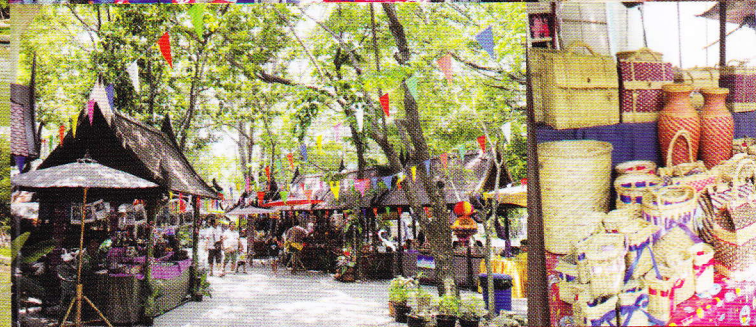
ของที่ระลึก สินค้าภูมิปัญญาไทย