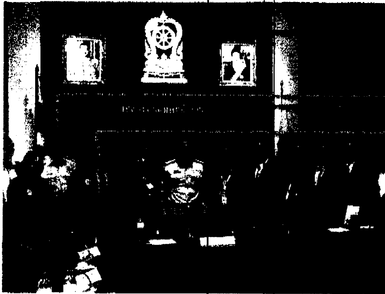
พลเอกดาว์พงษ์ รัตนสุวรรณ (รมว.ศธ.)