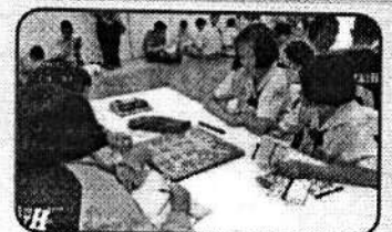
ศูนย์กีฬา Mix Time โทรี www.maxplays.com